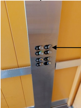
Ouverture de la porte côté couloir avec clé